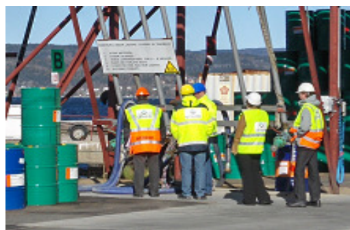
Bild 2. ESAD-revision på Univars terminal på Fagerstrand utanför Oslo

För ytterligare information kontakta Univars Miljö- och Kvalitetsavdelning på telefon 031-838000 eller på adress Univar AB, Box 48, 401 20 GÖTEBORG.